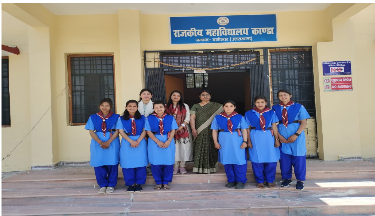
One day training camp was also organized for students on 15-04-2023