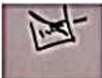
(Ram Singh Negi) STC (S/G)

has successfully undergone Beginner's Course (Online) from 10/08/2020 to 12/08/2020