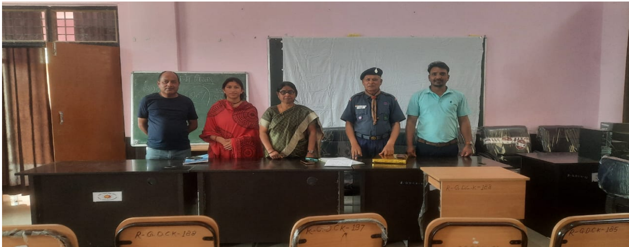
One day introduction training session on 12-04-2022